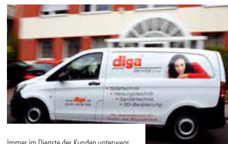
Immer im Dienste des Kunden unterwegs